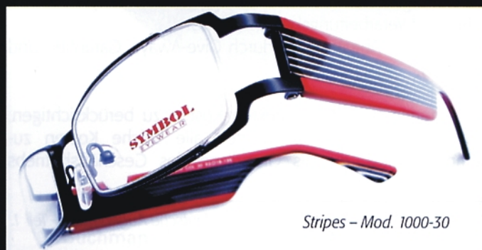
Stripes – Mod. 1000-30

Symbol Eyewear – Brillengalerie York Milchraum GmbH Hofstraße 12, 75417 Mühlacker, Tel. /Fax (0 70 41) 86 26-11/-12 E-Mail: info@symbol-eyewear.de , www.symbol-eyewear.de